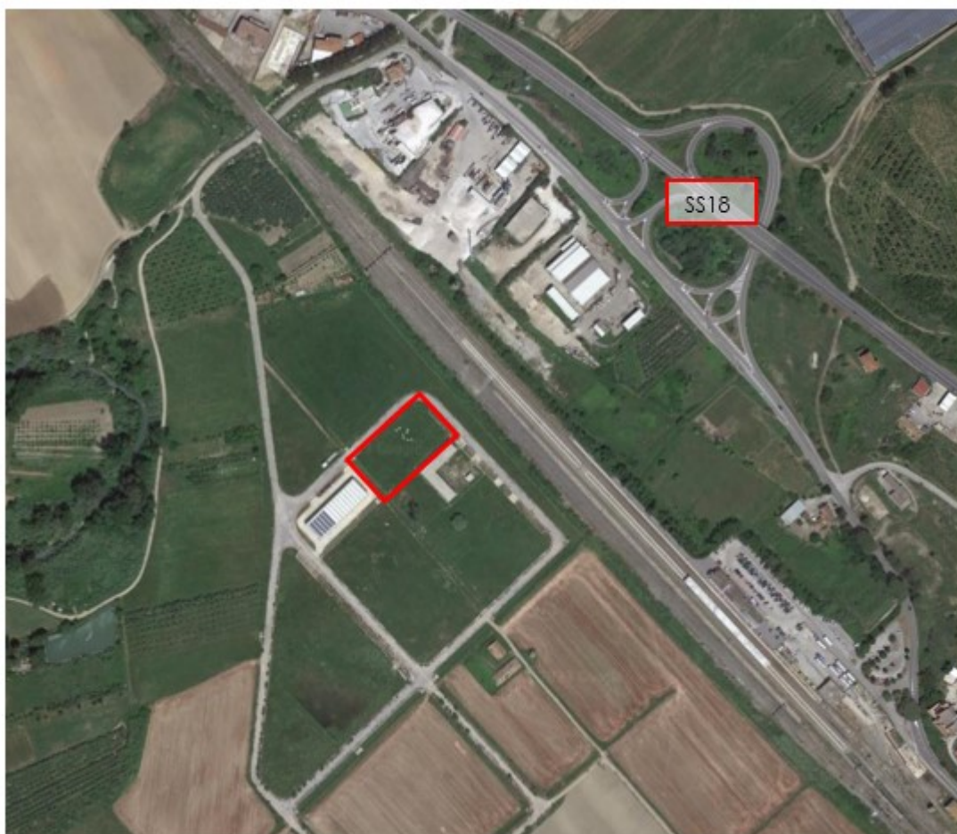
Figura 3: Inquadratura aerofotogrammetrica dell'area del futuro trattamento di essiccazione fanghi (in rosso) e della strada SS18

I fanghi in ingresso all'essiccatore sono provenienti dai depuratori di Ascea Marina, Casal Velino Marina, Camerota Marina, Castellabate Maroccia, Centola Portigliola, Sapri, Vallo della Lucania e Vibonati. Tali fanghi derivano dal trattamento delle acque reflue urbane mediante processi a fanghi attivi ad aerazione prolungata e saranno caratterizzati da una concentrazione di sostanza secca media pari al 22,0% grazie alla realizzazione di una nuova sezione di disidratazione meccanica.