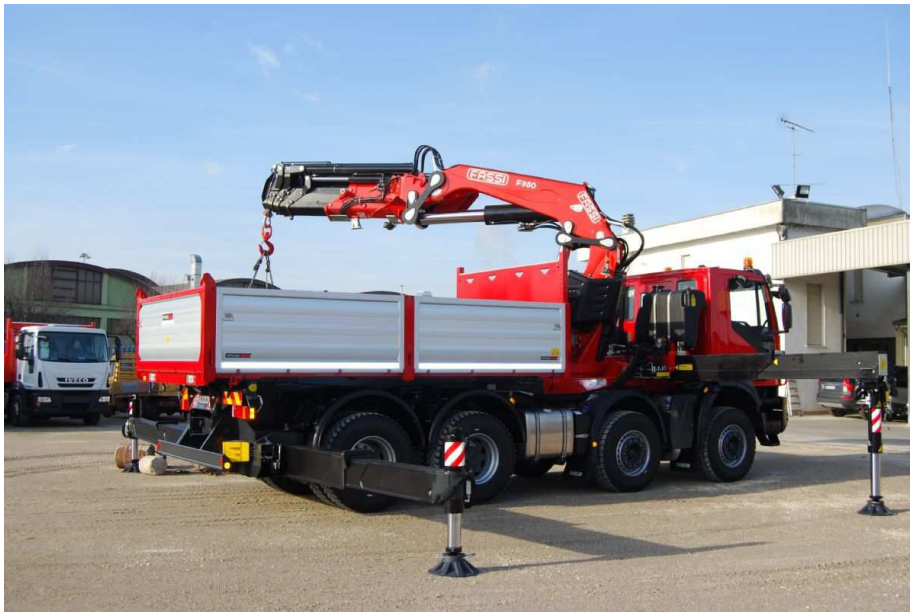
Figura 6: Autocarro con gru per la movimentazione dei carichi

Nel caso in esame verranno utilizzati autocarri con gru, dotati di tutti i dispositivi di sicurezza previsti dalle normative (fissaggio durante il trasporto, limitatori di carico e di momento, limitatori di prestazione, valvola di massima generale, coppiglie, fermagli di sicurezza, dispositivi di sicurezza degli stabilizzatori, segnalatore acustico, dispositivo di arresto di emergenza, ...).