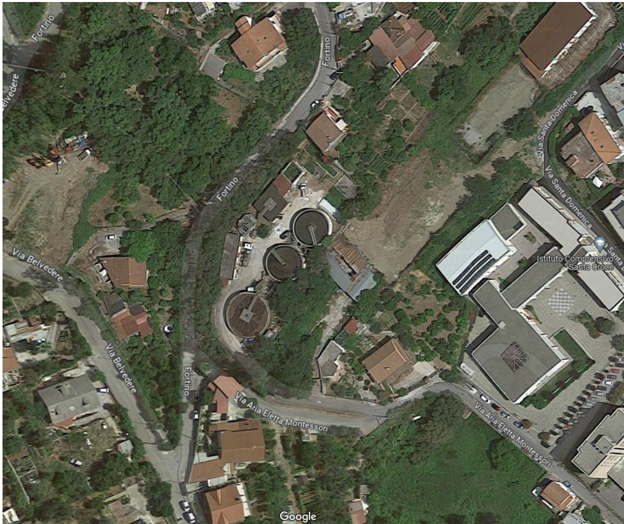
Figura 5: Dettaglio dell'impianto di Sapi.

L'impianto è collocato all'interno del centro abitato, circondato da abitazioni e prati, come riportato in Figura 5.