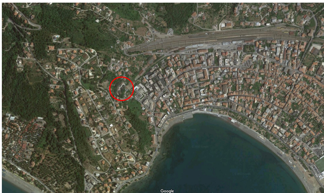
Figura 4: Inquadramento aerofotogrammetrico dell'impianto di Sapri.

L'impianto oggetto di intervento è localizzato in zona ovest del comune di Sapri (Figura 4).