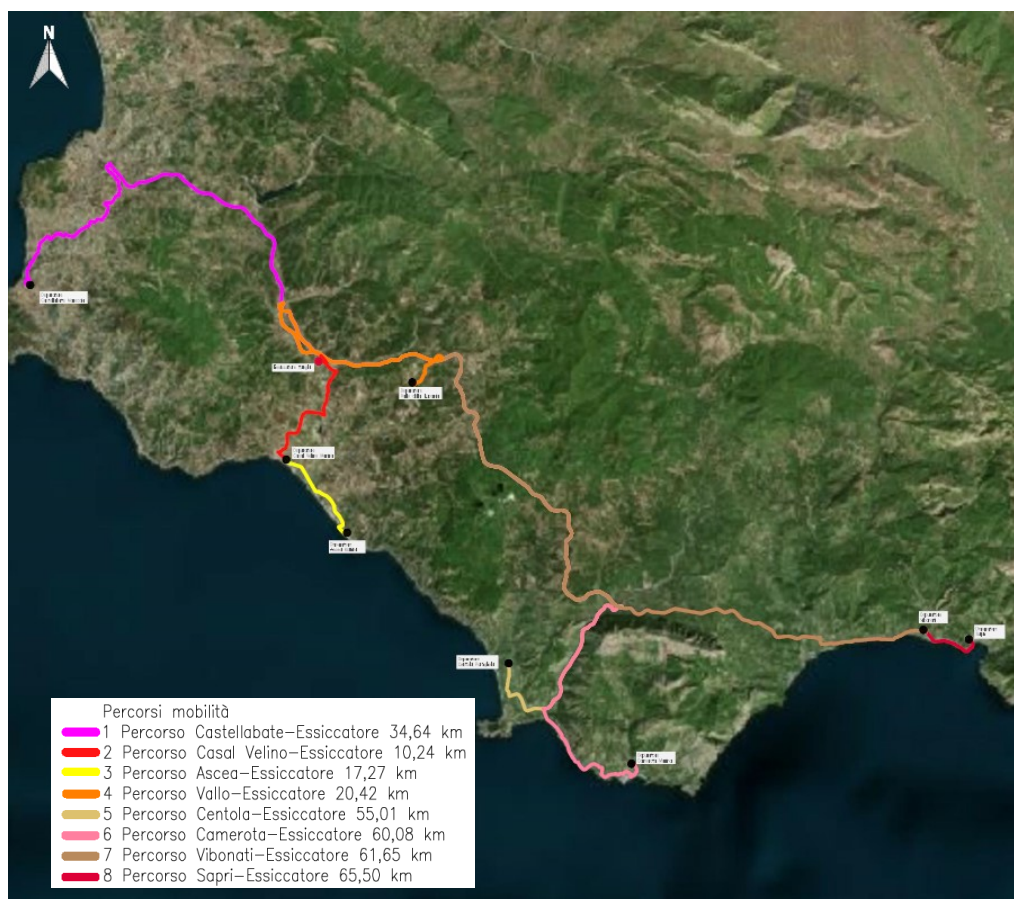
Figura 1: Ubicazione degli impianti di depurazione Consac oggetto di studio (in rosso l'impianto di essiccamento, in nero gli 8 impianti di disidratazione) e della viabilità di collegamento.

Al fine di migliorare la gestione dello smaltimento dei fanghi prodotti in diversi impianti di Consac, l'intervento di riqualificazione del sistema di trattamento dei fanghi prevede la realizzazione di un impianto "hub" di bioessiccazione fanghi, ricevente in ingresso fanghi disidratati da n.8 depuratori a servizio di aree costiere e di rilevante vocazione turistica, nonché di maggiore produzione (Ascea Marina, Casal Velino Marina, Camerota Marina, Castellabate Maroccia, Centola Portigliola, Sapri, Vallo della Lucania e Vibonati). Tali fanghi sono esclusivamente secondari, provenienti dal trattamento delle acque reflue urbane.