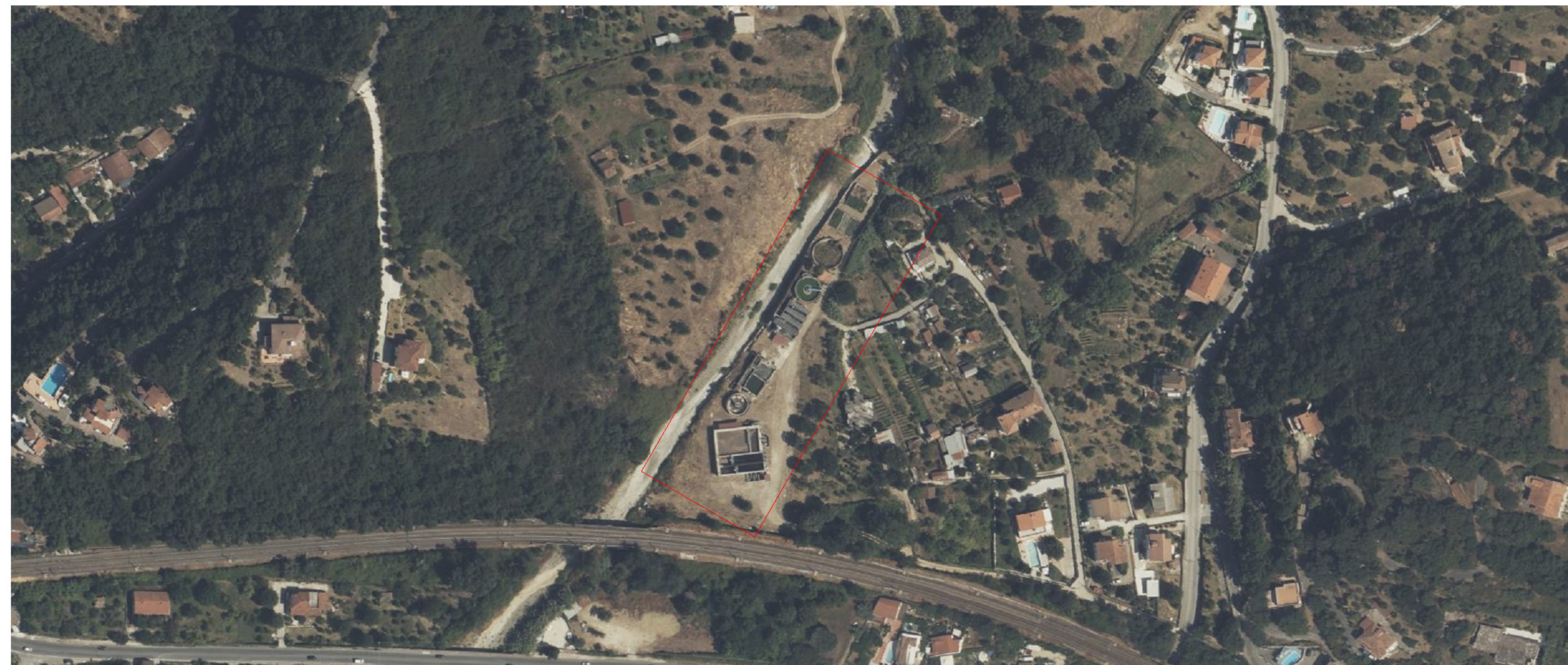
Ortofoto scala 1:2000