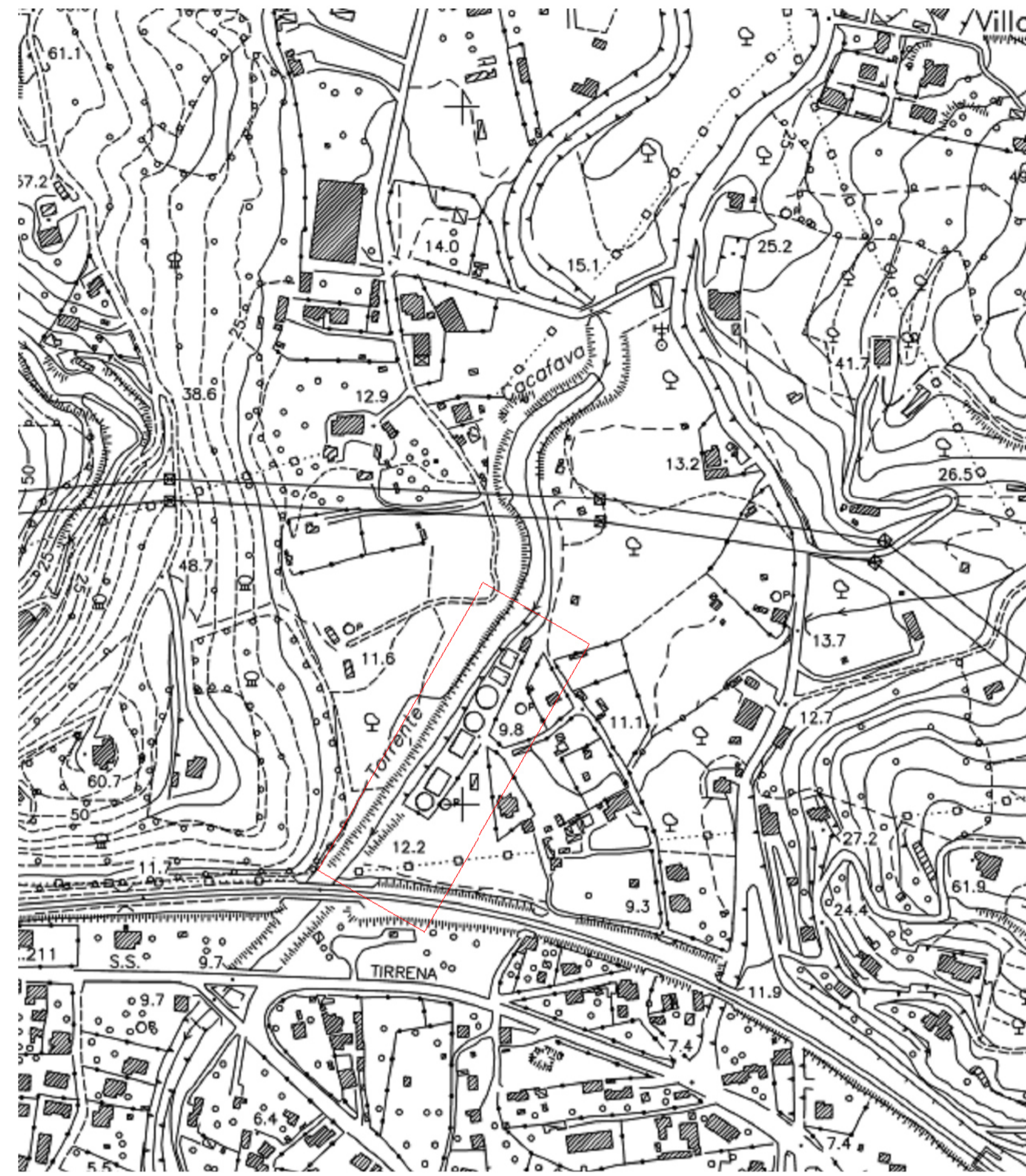
Carta Tecnica scala 1:2000