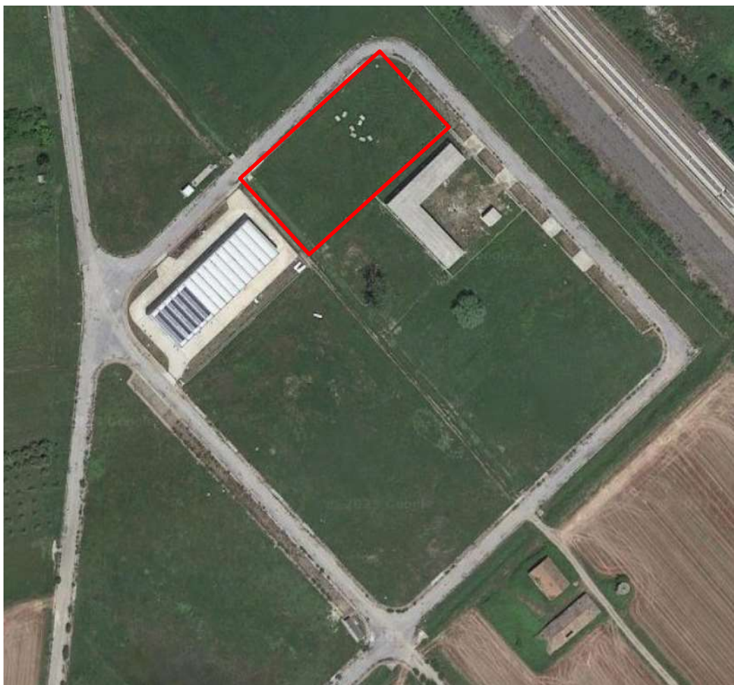
Figura 2: Inquadramento su ortofoto dell'area prevista per la realizzazione dell'impianto di essiccazione fanghi (in rosso)

In particolare da un punto di vista catastale il sedime individuato per la costruzione dell'impianto di essiccazione ricade all'interno della particella 403- Foglio 7 del comune di Casal Velino, come mostrato in Figura 3. Il Comune di Casal Velino, con Attestato di destinazione urbanistica Prot. N. 11011 del 28/09/2023, ha attestato a Consac che l'area è classificata come zona artigianale "D", e che non rientra tra le aree percorse dal fuoco ai sensi della legge 353 del 21/11/2000, né nella perimetrazione del Parco Nazionale del Cilento e Vallo di Diano e Alburni, né in vincolo idrogeologico ai sensi dell'art.1 del R.D. del 30/12/1923 n.3267.