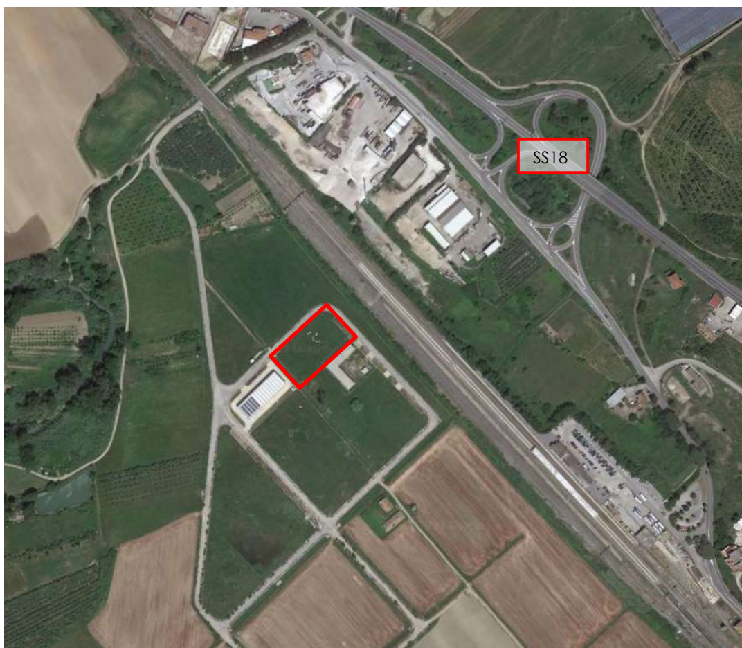
Figura 5: Inquadramento aerofotogrammetrico dell'area del futuro trattamento di essiccazione fanghi (in rosso) e della strada SS18

I fanghi in ingresso all'essiccatore sono provenienti dai depuratori di Ascea Marina, Casal Velino Marina, Camerota Marina, Castellabate Maroccia, Centola Portigliola, Sapri, Vallo della Lucania e Vibonati. Tali fanghi derivano dal trattamento delle acque reflue urbane mediante processi a fanghi attivi ad aerazione prolungata e saranno caratterizzati da una concentrazione di sostanza secca media pari al 22,0% grazie alla realizzazione di una nuova sezione di disidratazione meccanica.