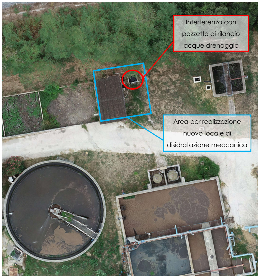
Figura 6: Individuazione su ortofoto dell'interferenza superficiale nell'impianto di Ascea