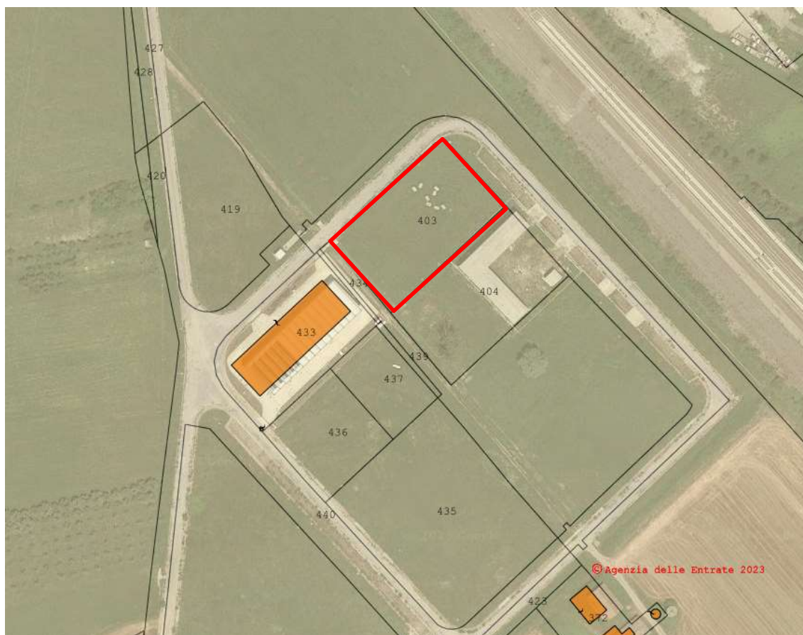
Figura 3: Inquadramento catastale dell'aria in cui è prevista la realizzazione dell'impianto di essiccamento (in rosso)